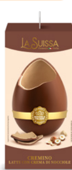
UOVO CREMINO 350g