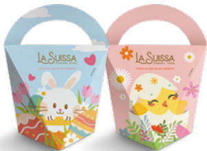
BORSETTA PASQUA 150g