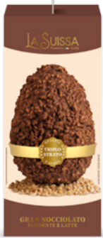
UOVO GRAN NOCCIOLATO 500g