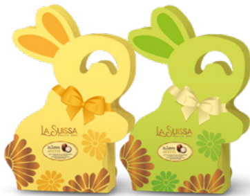
BUNNY GIALLO/VERDE 200g