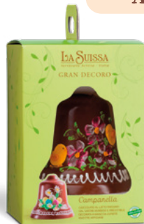
CAMPANELLA DECORATA LATTE 260g