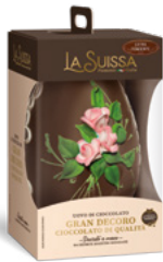
UOVO GRAN DECORO FONDATE 360g