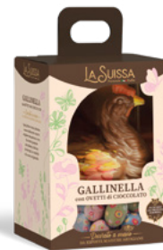
GALLINELLA PASQUALE CON MAXI OVETTI 320g