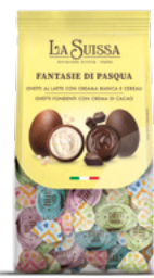
OVETTI ASSORTITI 600g