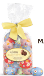
FIOCCO MAXI OVETTI 400g