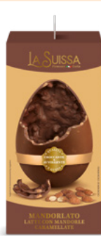
UOVO MANDORLATO 360g