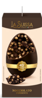
UOVO NOCCIOLATO FONDATE 450g