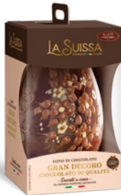
UOVO GRAN DECORO LATTE 500g