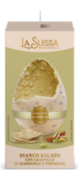
UOVO BIANCO SALATO 320g