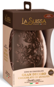
UOVO GRAN DECORO FONDATE 500g