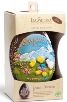
UOVO GRAN DECORO FONDATE 1050g