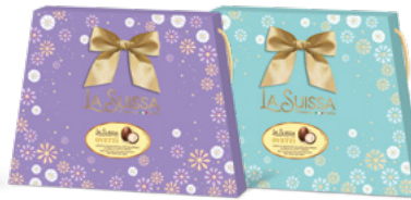
BORSA LILLA/AZZURRA 280g