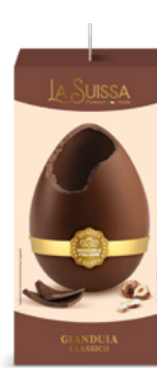
UOVO GIANDUIA 350g