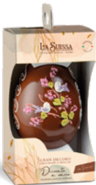
UOVO GRAN DECORO LATTE 360g