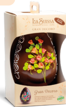
UOVO GRAN DECORO LATTE 1050g